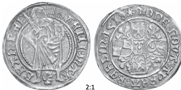
Abb. 3: Goldgulden 26 mm