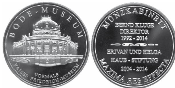
Abb. 4: Medaille Bodemuseum 40 mm, Foto: Helmut Caspar, Berlin.